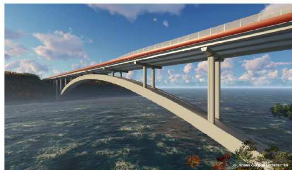
Figure 5 : Photomontage du pont élargi vu depuis la rive droite (source : dossier)

Dans la mesure du possible, il pourrait être intéressant, compte tenu de la durée programmée des travaux, que les protections acoustiques puissent être réalisées en début de chantier, au moins pour les isolations de façades.