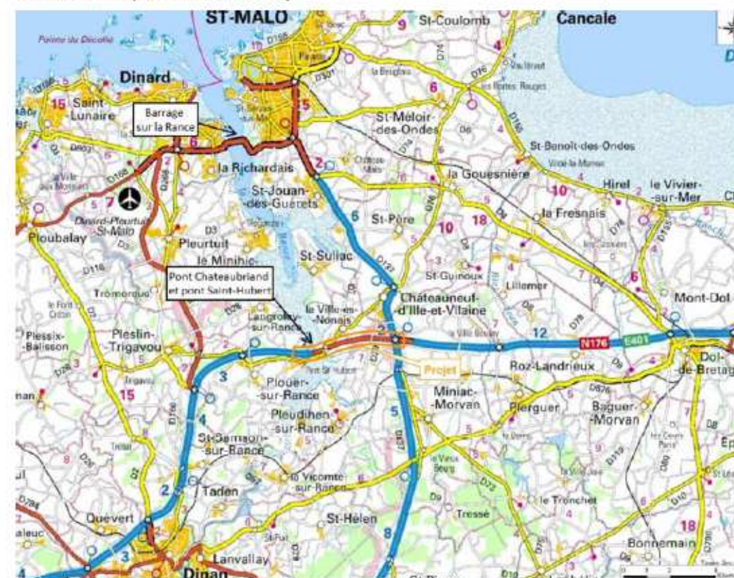
Figure 1 : Territoire du projet (source : dossier)

La RN 176 relie les Côtes-d'Armor et l'Ille-et-Vilaine en traversant l'estuaire de la Rance à une dizaine de kilomètres au sud du barrage de l'usine marémotrice. Cette route, importante pour les déplacements locaux et régionaux, est à 2x2 voies sur la presque totalité de son parcours, mais est à 2x1 voie entre l'ouest de La Rance et l'échangeur de La Chênaie, qui marque son intersection avec la RD 137 (Rennes - Saint-Malo).