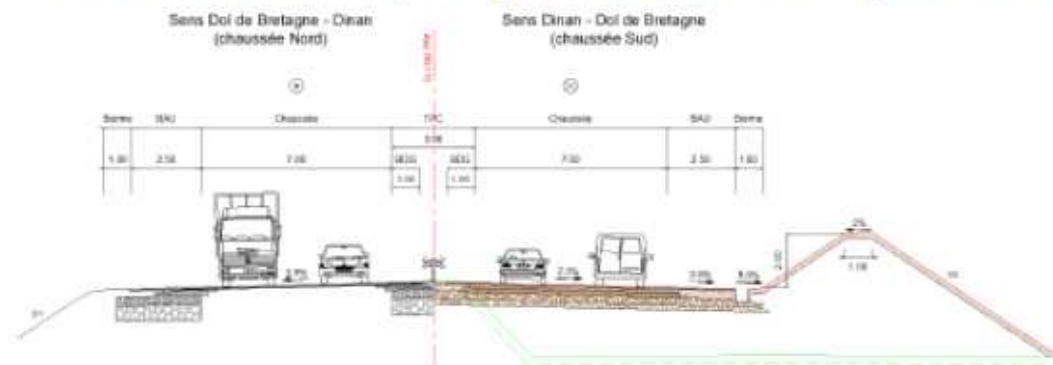
Figure 2 : Profil en travers de la section courante, situation en remblais avec merlon

Des merlons ou des écrans acoustiques sont prévus selon les besoins et la configuration des lieux.